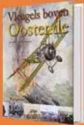
Vleugels boven Oostende

Kies zelf je welkomsgeschenk t.w.v. €29 Choisissez votre cadeau de bienvenue d'une valeur de €29